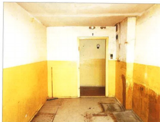
Widok fragmentu kuchni.