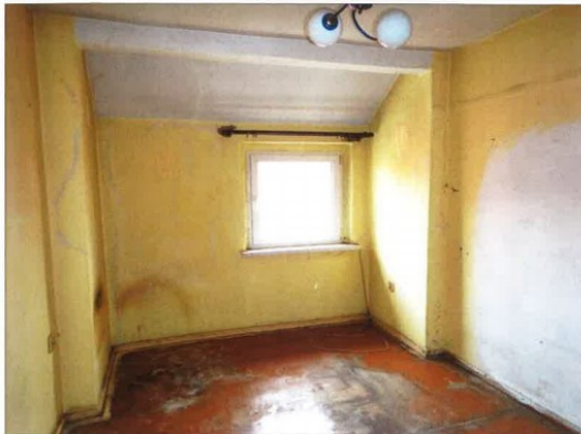
Widok fragmentu pokoju.