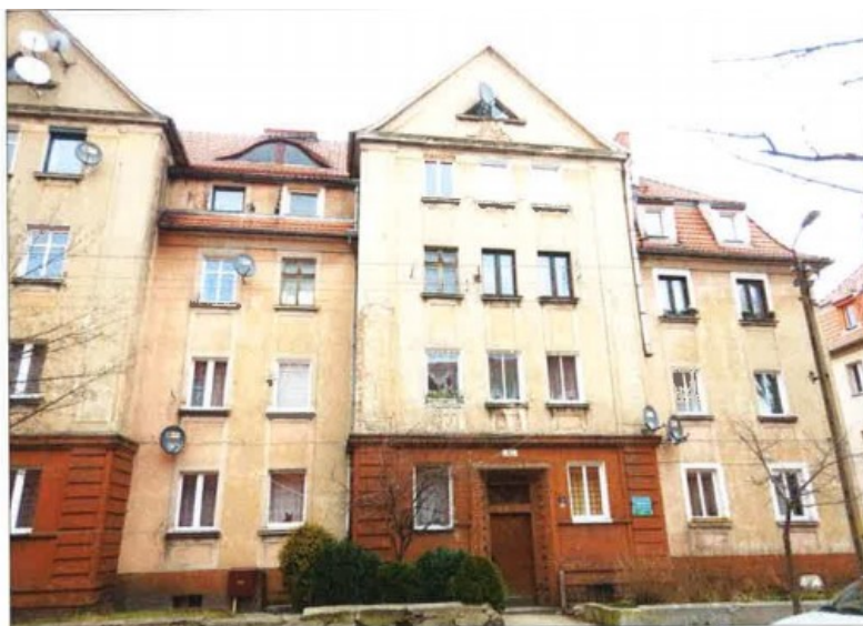
Widok elewacji frontowej – ul. Juliusza Słowackiego nr 15b.

na sprzedaż lokalu mieszkalnego Nr 14 znajdującego się w budynku położonym w Lubaniu przy ul. Juliusza Słowackiego 15a wraz z udziałem we współwłasności nieruchomości gruntowej (działka nr 58/11, AM 14, Obręb I o powierzchni 201 m 2 , JG1L/00020148/5)