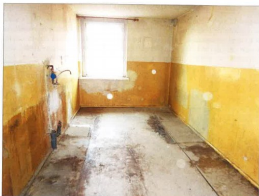
Widok fragmentu kuchni.